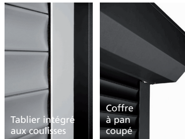
Tablet intégré aux coulisses