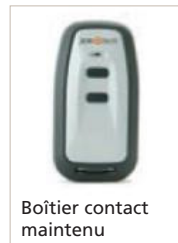
Boîtier contact maintenu